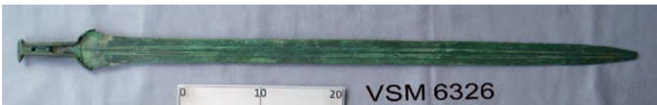
Fig. 1. Bronzesværdet fra Rødning sogn, Nørlyng herred.

Lad mig nu vende tilbage til depotfundet fra Rødning. Det drejer sig om et ret velbevaret grebtungesværd med smalt greb og markant, profileret kling, og det hører dermed til en sværdtype, der kan dateres til yngre bronzealder per. IV (Baudou 1960:9). Viborg Stiftsmuseum købte i 1930 sværdet for 120 kr. af gårdejer Lars Nymand, Rødning. I museets Dagbog findes følgende optegnelse: